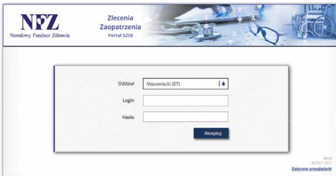
Okno logowania do SZOI Zlecenia Zaopatrzenia (eZWM).

Dane dostępowe są nadawane przez świadczeniodawcę rozliczającego – czyli podmiot posiadający podpisaną umowę z NFZ z zakresu zaopatrzenia w wyroby medyczne. W przypadku każdej apteki/sklepu medycznego będących Podwykonawcą Essity, świadczeniodawcą rozliczającym jest Essity. Możliwość zalogowania się do strony na podstawie wcześniej przesłanych przez Essity danych dostępowych będzie od 1 stycznia – zgodnie z dniem wejścia w życie nowych przepisów.